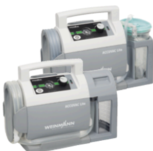
ACCUVAC Lite mit Einwegbehältersystem, WM 11705

Wählen Sie Ihre Wunschkombination der ACCUVAC Lite – abgestimmt auf Ihre Bedürfnisse: