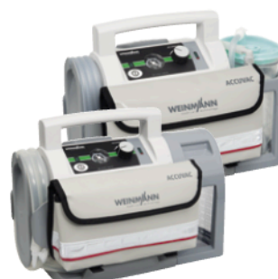
ACCUVAC Lite mit Einwegbehältersystem und Zubehörtasche, WM 11745