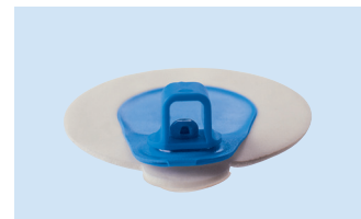
A = 4 mm Anschluss