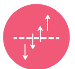
Atmungs- aktiver Träger