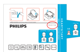
M5072A Sachet en aluminium