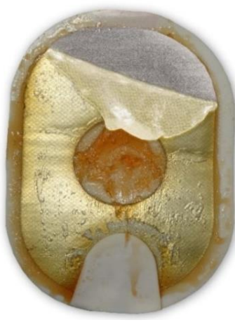
Figure 2 : le gel décollé et replié peut également sembler décoloré et/ou fondu.

Action : Appliquez les électrodes sur le patient. N'hésitez pas.