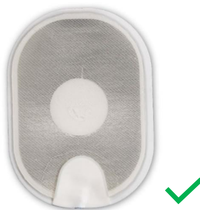
Figure 4 : électrode normale.