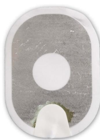
Figure 3 : gel presque complètement décollé du support.

Action : Appliquez les électrodes sur le patient. N'hésitez pas.