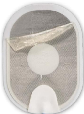
Figure 1 : gel décollé qui s'est replié sur lui-même lors du retrait de la feuille de protection.

Il est également possible que le gel se décolle presque complètement du support en mousse/étain lors du retrait de la feuille de protection (voir Figure 3.) Si la surface de contact du gel avec la peau est petite, un arc électrique peut se produire lorsqu'un choc est délivré, ce qui peut provoquer des brûlures sur la peau du patient. Il est aussi possible que le DAE ne puisse pas délivrer de choc à travers les électrodes. Un retard de traitement se produit lorsque l'utilisateur installe une cartouche d'électrodes de rechange (si disponible) ou effectue une RCP (réanimation cardiopulmonaire) ou un massage cardiaque en attendant l'arrivée du personnel des services médicaux d'urgence. À titre de comparaison, la Figure 4 montre une électrode normale. Quel que soit l'état de l'électrode, suivez les consignes vocales, car le DAE vous guidera tout au long des étapes nécessaires.