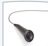
Poire de réponse patient