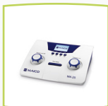
Appareil MA 25