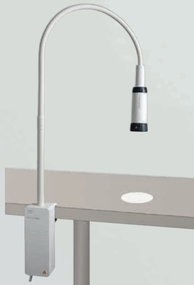
EL10 LED Untersuchungsleuchte mit Klemmhalterung

Nähere Informationen finden Sie auf www.heine.com