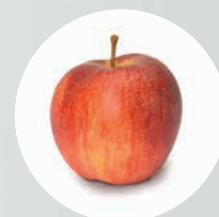
LED HQ : rot bleibt rot