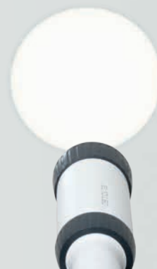
Das ist LED HQ : Licht in HEINE Qualität