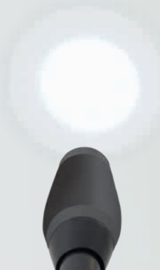
Das ist eine herkömmliche LED

Der kompakte Leuchtkopf (Ø ca. 60 mm) gestattet eine annähernd koaxiale Beleuchtung, insbesondere in schwierigen Anwendungssituationen.