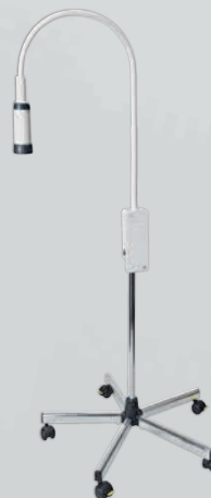
EL10 LED Untersuchungsleuchte mit Rollstativ aus Metall